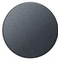
Meteor Grey Mica (42A)