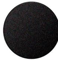
Jet Black Mica (41W)