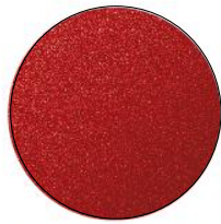
Soul Red Metallic (41V)