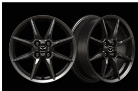
ALLIAGE 16" « GUNMETAL » 195/50 R16