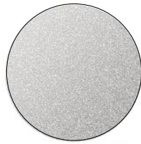
Ceramic Metallic (47A)