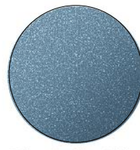
Blue Reflex Mica (42B)*