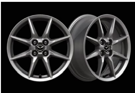
ALLIAGE 16" « ARGENT » 195/50 R16