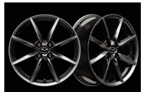
ALLIAGE 17" « BRIGHT DARK » 205/45 R17