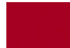
Velocity Red (41H)*